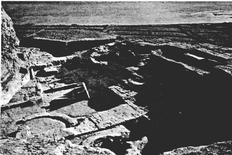
Abb. 5. Tall 'Ašara-Terqa, Stadtmauer